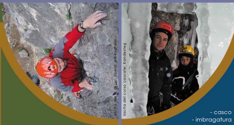
Uscita del corso cascate: Kandelberg