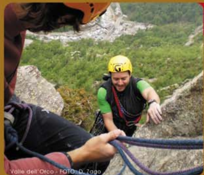
Valle dell'Orco