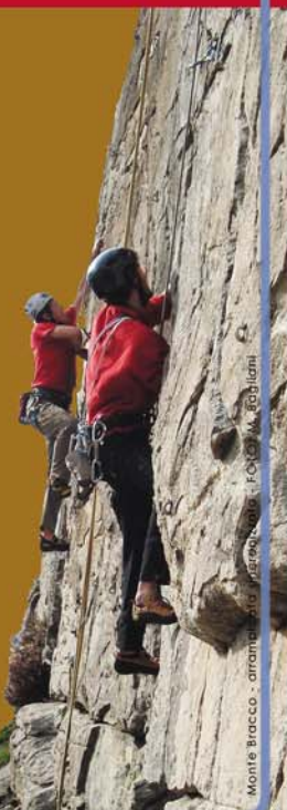
Monte Bracon - arrampicata libera