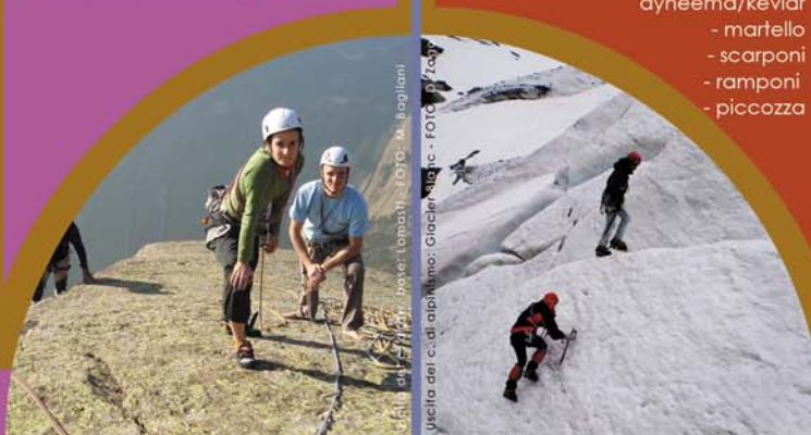
Uscita del corso di alpinismo: Glacier Station