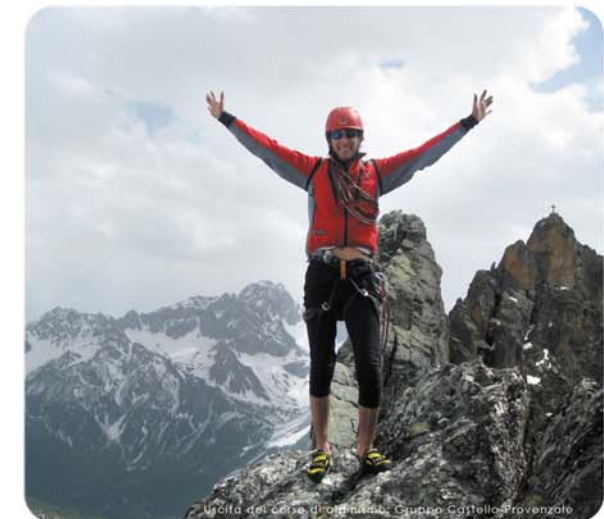
Monte Bracon - arrampicata libera - Gruppo Castello-Provenzale