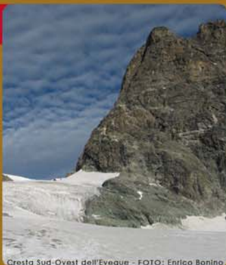
Cresta Sud-Ovest dell'Eveque - FOTO: Enrico Bonino

Le iscrizioni si effettuano presso la sede della Sezione di Torino del C.A.I., via Barbaroux n.1 (011-546031), orario di segreteria lun - ven 14.00 - 18.00, oppure nello stesso giorno della presentazione dei singoli corsi.