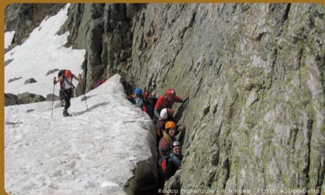
Rocca Provenzale - in Mincan

Per la partecipazione ai corsi di base non sono richieste specifiche capacità o esperienze, ma solo una normale preparazione fisica, oltre al desiderio e alla curiosità di avvicinarsi al mondo della montagna, per svolgere una delle più affascinanti attività umane. Per i corsi avanzati occorre invece una preparazione specifica.